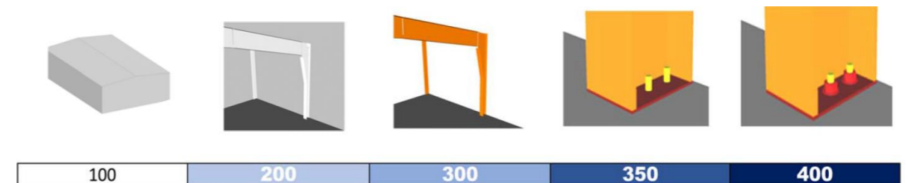
Fig. 05. Ilustración de la Guía de Especificación LOD de BIM Forum

El PEB inicial, sujeto a aprobación por parte de la persona responsable BIM de EMACSA, establecerá el nivel de detalle geométrico mínimo que debe alcanzar cada tipo de objeto para poder responder a los objetivos previstos para la actuación mediante la utilización de la tabla de objetos del ANEXO 05. Nivel de detalle geométrico de objetos BIM .